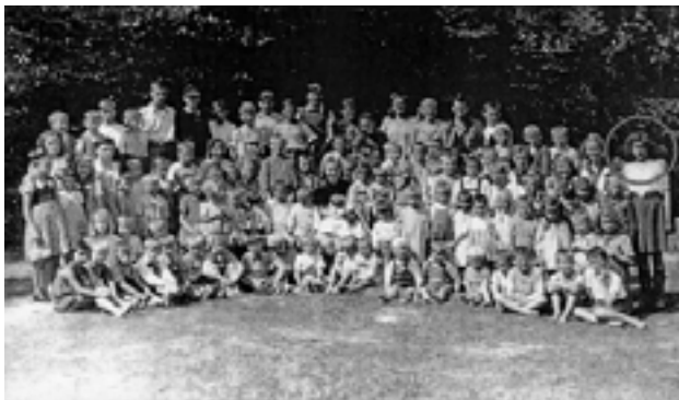
Ukradeno otroštvo: Otroci s Petrička

Združeni ob Lipi sprave smo doslej vsako leto 27. aprila pri Lipi sprave na ljubljanskih Žalah izobesili državno zastavo s črnim žalnim trakom.