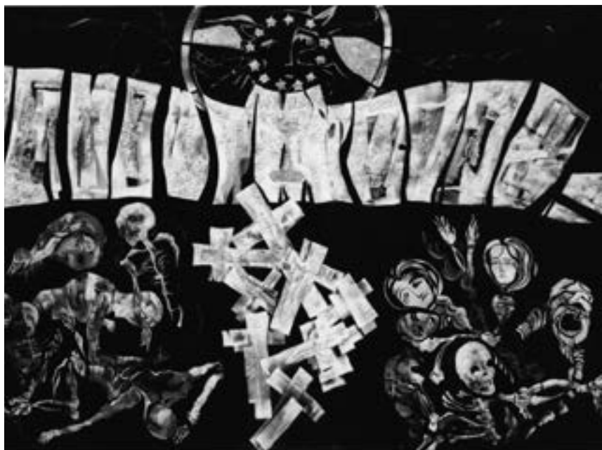
SLIKA: Marjetka Dolinar