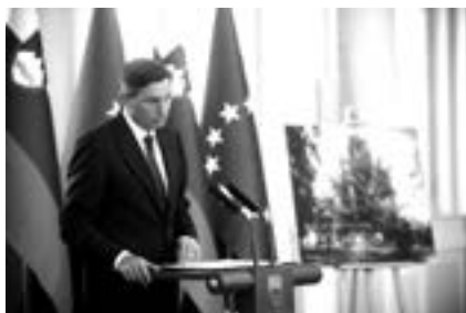
Borut Pahor, predsednik Republike Slovenije